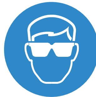
Používej chranné brýle